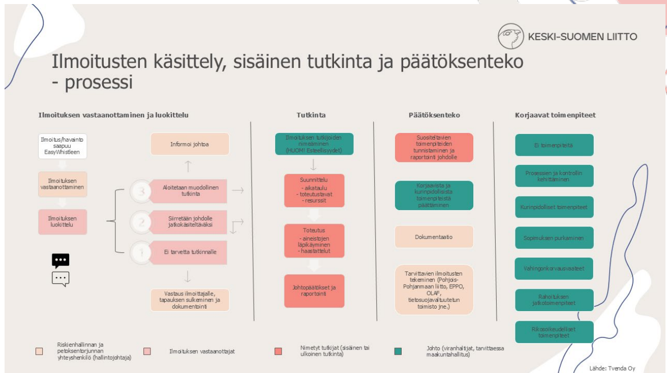
Kuva 1. Prosessikuva

Ilmoittajan rooli asian selvityksessä ei pääty ilmoituksen lähettämiseen. Ilmoituksen käsittelijät saattavat tarvita ilmoittajalta lisätietoa tai vastauksia tarkentaviin kysymyksiin. Ilmoittajalla ei ole velvollisuutta vastata lisätietopyyntöihin, mutta yhteydenpito ilmoitusten käsittelijöiden kanssa parantaa mahdollisuuksia ilmoitetun asian selvittämiseen ja rikkomukseen puuttumiseen.