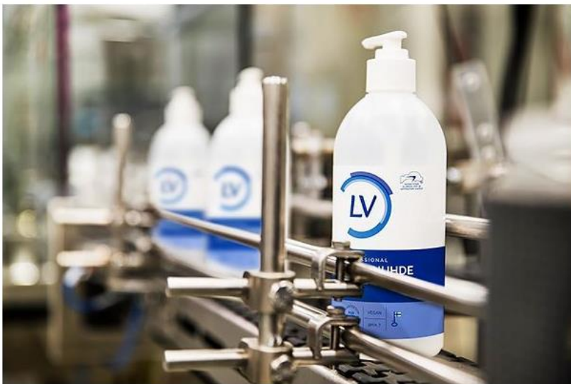
Kuva. Käsihuuhteen valmistuslinja Heinäveden tehtaalla.

Monialayhtiö Berner teetti materiaalikatselemuksen yhdellä kolmesta Heinävedellä sijaitsevassa tehtaassaan. Katselemuksen esiin tuomilla parannustoimilla on saavutettu jo yli 30 000 kilon raaka-ainesäästöt ja jätemäärät ovat pienentyneet yli 25 000 kiloa. Tämä tarkoittaa myös luonnonvarojen säästymistä ja yli 100 000 euron rahallisia säästöjä.