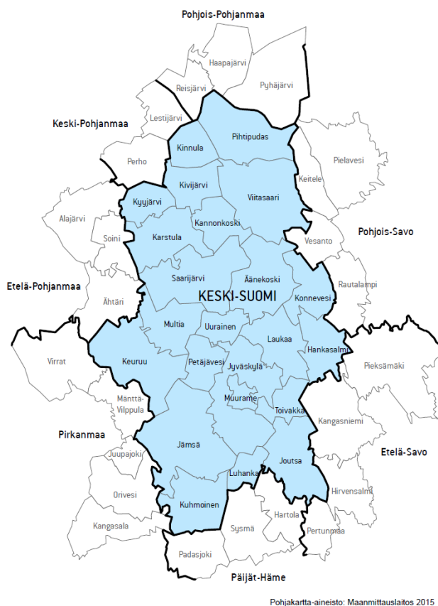
Kuva 3. Keski-Suomen rullaavan maakuntakaavoituksen vaikutusalue.

Maakuntakaavan vaikutusten arviointi on jatkuvaa, ja arvioinnissa on keskeisesti mukana maakunnallinen eri alojen asiantuntijoista koostuva ympäristö- ja tasa-arvovaikutusten arviointiryhmä (YVA-ryhmä). Tätä voidaan täydentää muutostarpeen/muutostarpeiden mukaisilla asiantuntijoilla. Arvioinnissa voidaan käyttää myös konsulttia.