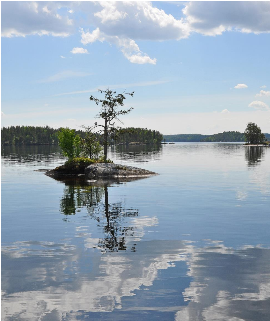
Puhtaat vesistöt ovat yksi Keski-Suomen vetovoimatekijä Kuva Etelä-Konneveden kansallispuistosta