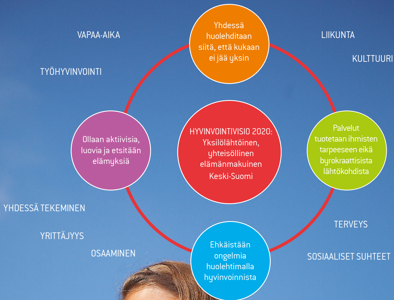
Kuva 1. Keski-Suomen hyvinvointivisio, strategiassa määritellyt hyvinvointilupaukset ja laaja-alaisen hyvinvointikäsitteen osatekijät.