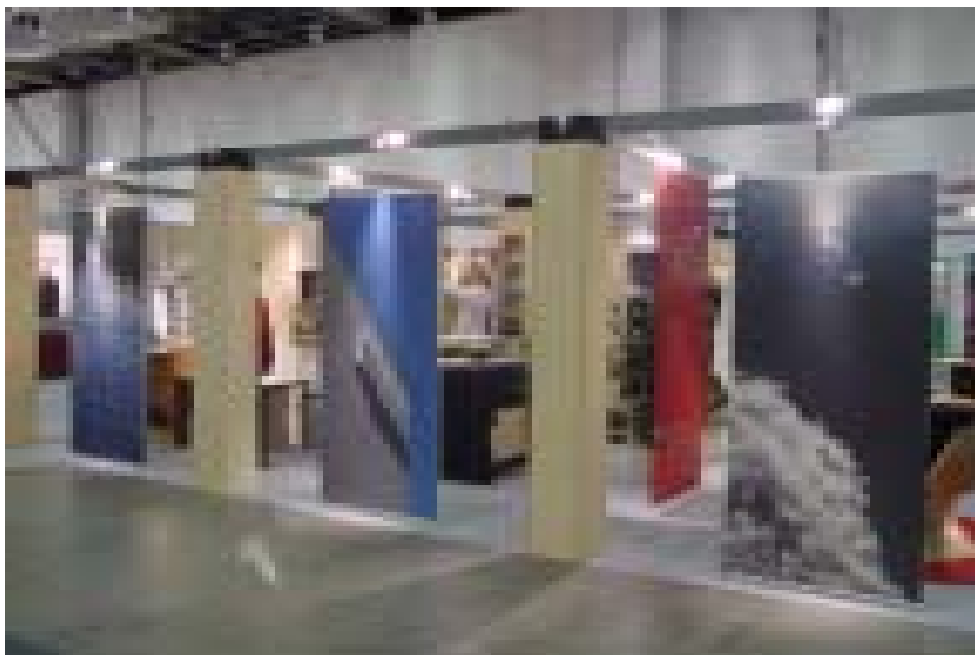
Kuva: Keski-Suomen osasto Elma-messuilla Helsingissä.

Marraskuun 21.-23. päivä Helsingissä järjestetyillä ELMA-messuilla keski-suomalaista osaamista tuotiin esille yhteisosastolla, jossa oli esillä maakunnan matkailu-, käsi- ja taideteollisuus- ja elintarvikehankkeita. Keski-Suomen liitto koordinoi yhteistä lehdistötiedotusta ja tiedotustilaisuuksia.