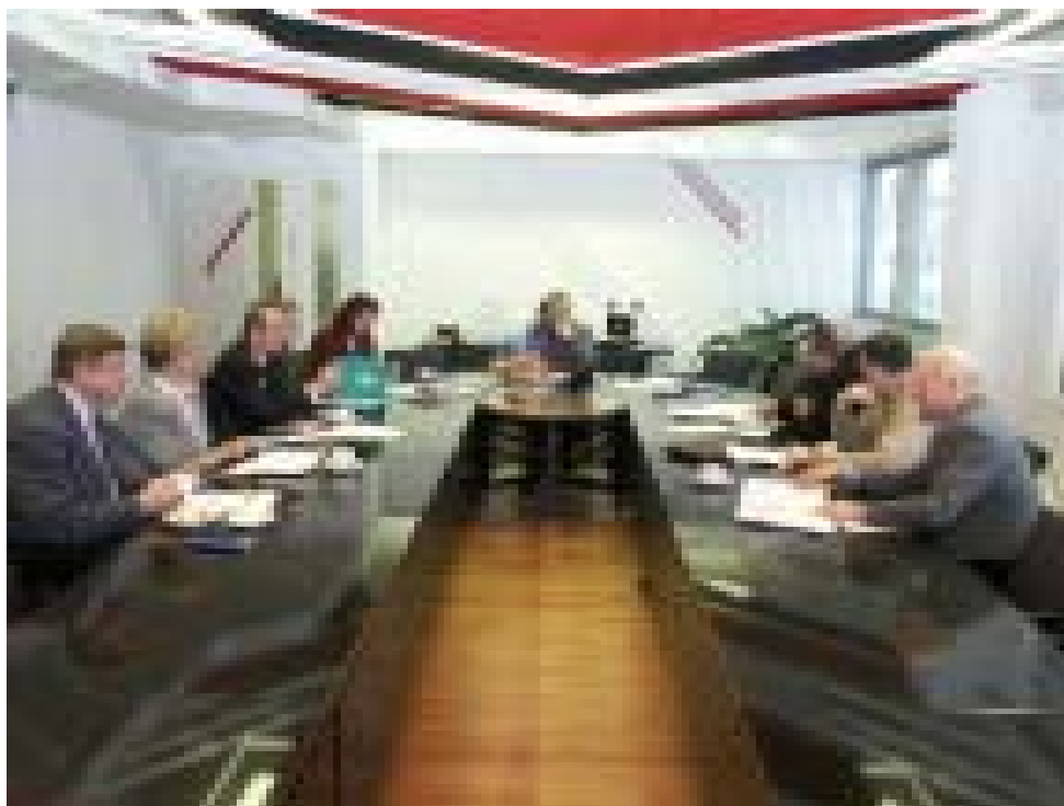
Kuva. Keski-Suomen liiton historiikin ohjausryhmän 1. kokous 5.12.2003.