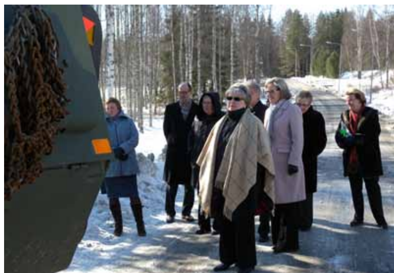
Maakuntahallitus tutustui Keski-Suomen rykmentin toimintaan kokousmatkallaan Keuruulla 27.3.2009.