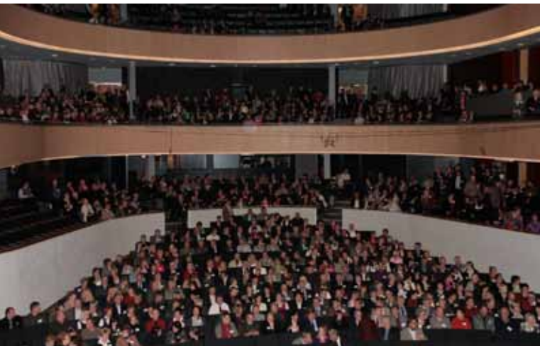
Keskisuomalaisia Sibeliustalolla Lahdessa.

Keski-Suomen liitto ja Jyväskylän kaupunki toimivat isäntinä TCI The Competitiveness Institute 12th Global Annual Conference -tapahtumalle lokakuussa. TCI-konferenssin organisaattorina toimi EduCluster Finland. Tapahtuma kokosi 350 osallistujaa 50 maasta. Järjestelyt ovat saaneet kiitosta ja teema Learning Clusters kiinnostusta maailmalla.