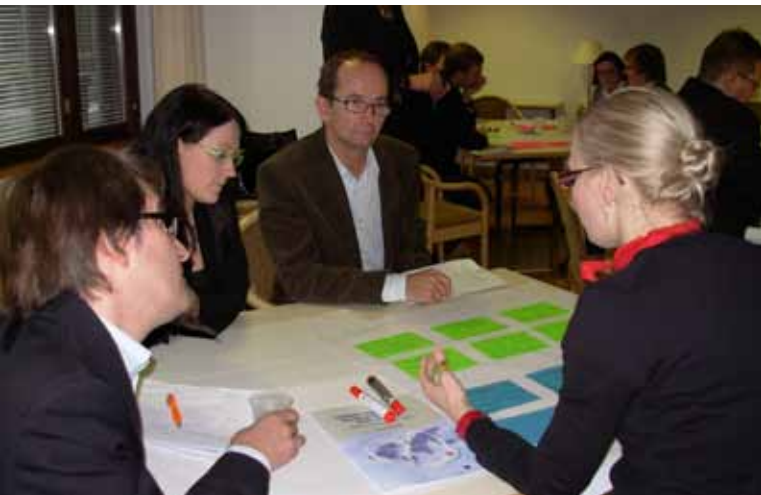
OSAT-työryhmä valmisteli Toimivat työmarkkinat -ohjelmaa marraskuussa 2009.

toimijoiden ja liiton välinen yhteistyö organisoitui ja tiivistyi. Yhteiselle kehittämiselle ja työllisyyden lisäämiselle muotoutui vahva yhteinen tahtotila.