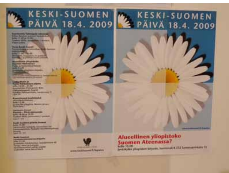
Keski-Suomen päivää juhlistettiin 18.4.2009.