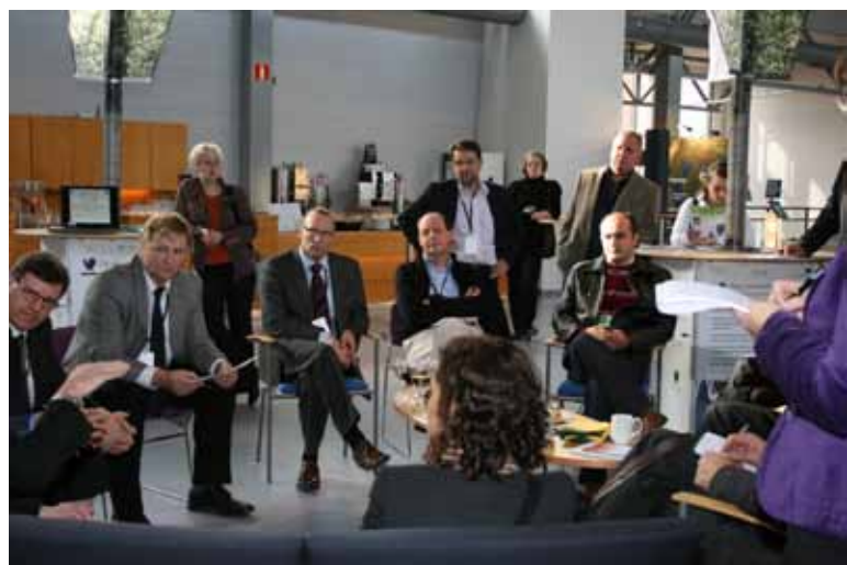
The Cluster Lounge TCI-konferenssissa.

Keski-Suomen liitto ja Jyväskylän kaupunki toimivat isäntinä TCI The Competitiveness Institute 12th Global Annual Conference -tapahtumalle lokakuussa. TCI-konferenssin organisaattorina toimi EduCluster Finland. Tapahtuma kokosi 350 osallistujaa 50 maasta. Järjestelyt ovat saaneet kiitosta ja teema Learning Clusters kiinnostusta maailmalla.