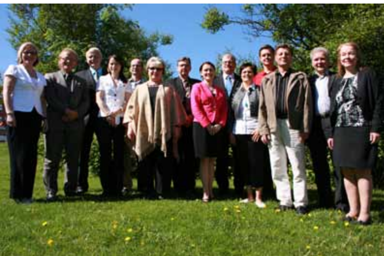
Tuore maakuntahallitus Keski-Suomen Talon edustalla 29.5.2009.

Maakuntahallitus kokoontui vuoden 2009 aikana 11 kertaa. Kokoukset pidettiin pääsääntöisesti Keski-Suomen liiton tiloissa, kerran keväällä Keuruun Vanhassa Pappilassa ja syksyllä Juhlahuvila Järvilinnassa sekä Muuramen kunnassa.